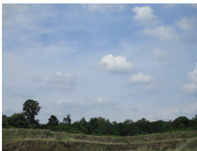
แนวเวนพื้นที่ทำเหมือง