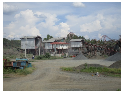
พื้นที่โรงโม่หินของโครงการ